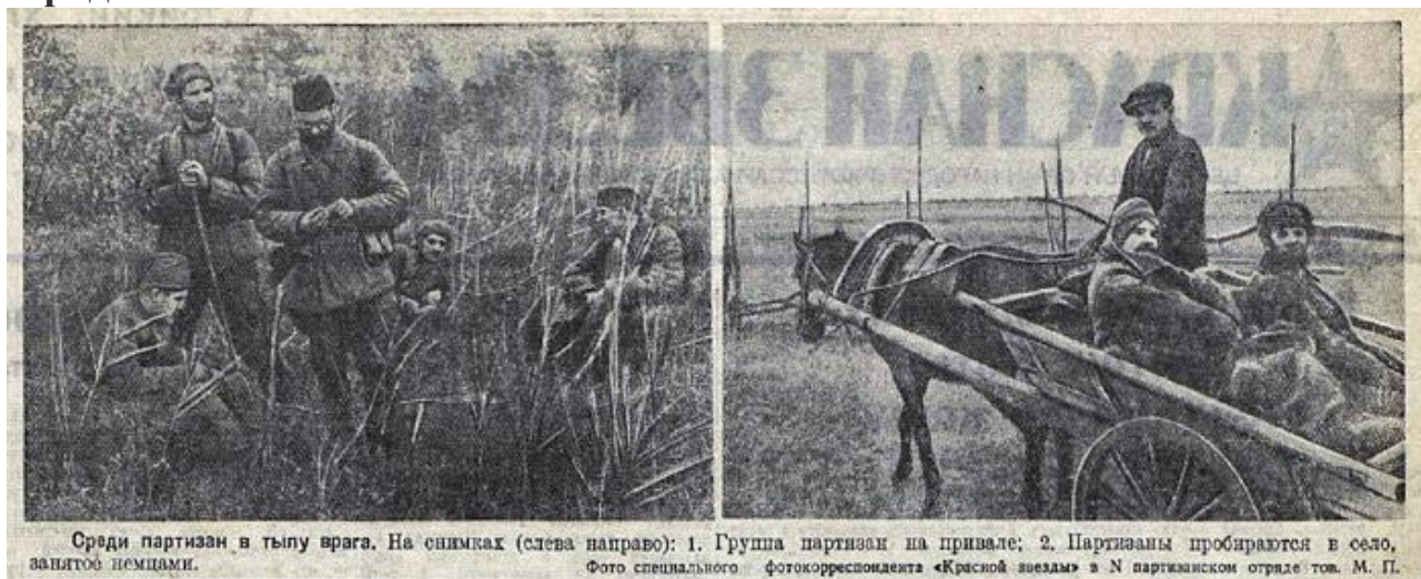
Среди партизан в тылу врага. На снимках (слева направо): 1. Группа партизан на привале; 2. Партизаны пробираются в село, занятое немцами.

Летом 1943 года советским командованием было принято решение о нанесении удара по столь важной составляющей немецкой военной машины, а роль главных исполнителей замысла Ставки отводилась партизанским отрядам.