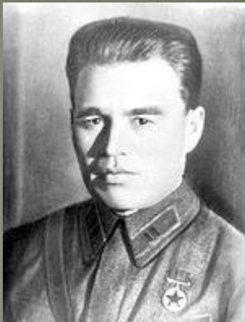
Майор П. М. Гаврилов

Были сообщения, что последние участки сопротивления были уничтожены лишь в конце августа, перед посещением крепости А. Гитлером и Б. Муссолини.