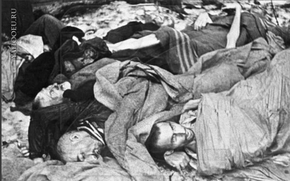
Искусственно зараженные малярией люди

С февраля 1942 по апрель 1945 в концлагере Дахау проводились эксперименты, целью которых было разработать вакцину от малярии.