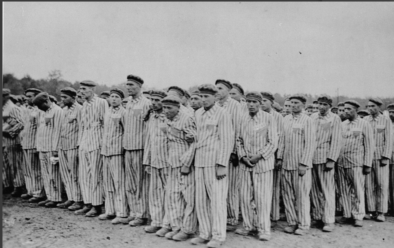
Концентрационный лагерь Бухенвальд

Эксперименты нацистов над людьми — серия медицинских экспериментов, проводившихся на большом числе заключенных в нацистской Германии на территории концентрационных лагерей во время Второй мировой войны.