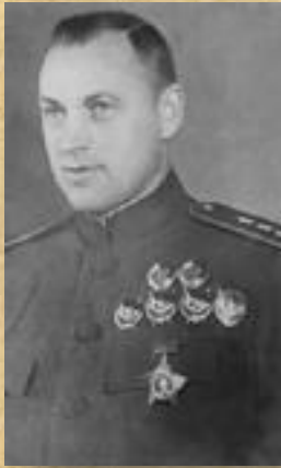
Рокоссовский К.К., командующий Центральным фронтом