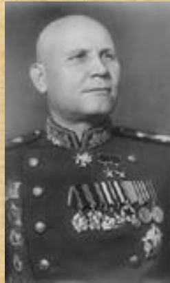
Конеv И. С., командующий Степным фронтом