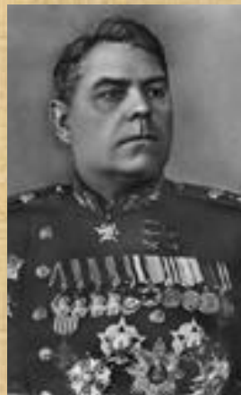
Василевский А.М., представитель Ставки