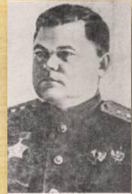
Н.Ф. Ватулин, командующий Воронежским фронтом