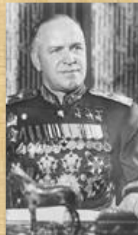
Жуков Г.К. представитель Ставки