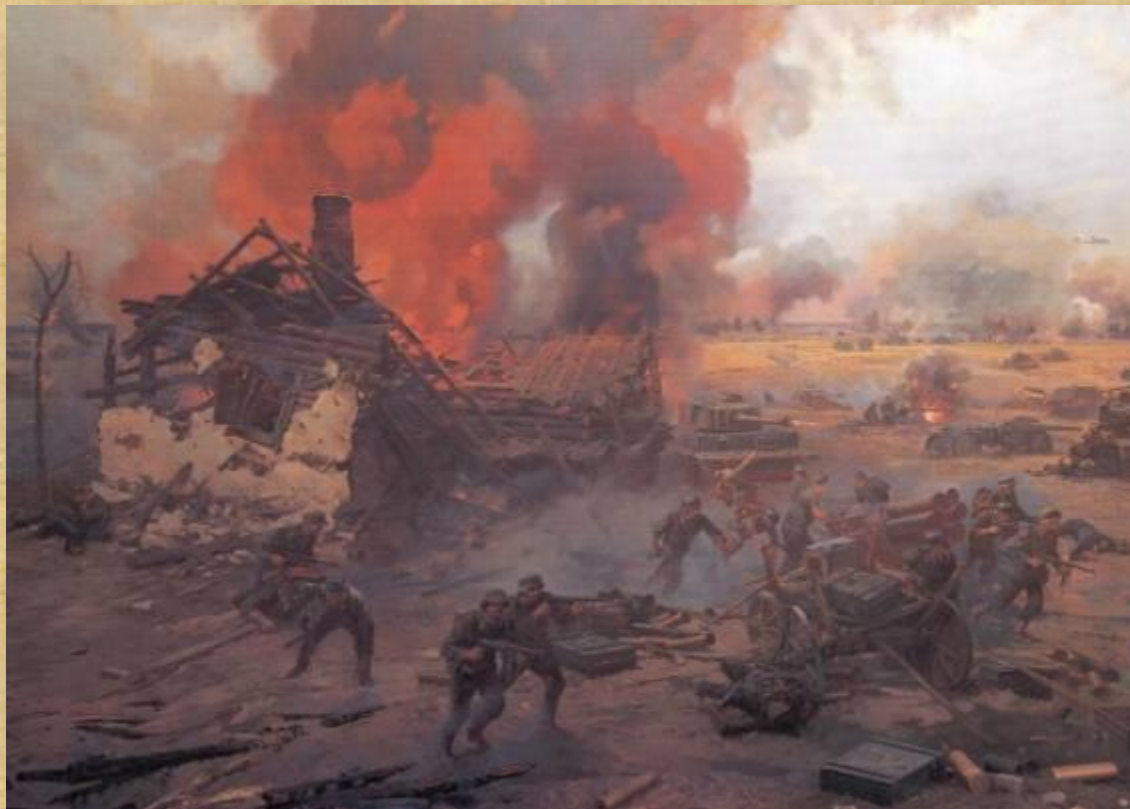
Курская битва (фрагмент диорамы). Присекин Н.С. 1995 г.

« В привычных сумерках суровых Полночным залпам торжества, Рукоплеща победе новой, Внимала древняя Москва. И голос праздничных орудий В сердцах взолнованных людей Был отголоском грозных буден, Был громом ваших батарей. И каждый дом и переулок, И каждым камнем вся Москва Распознавала в этих гулах- ОРЁЛ и БЕЛГОРОД- слова.» (А. Твардовский)