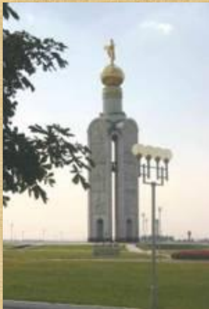
Памятник сражению под Прохоровкой

«Всё дальше от нас Грозные военные годы, Сегодня они- В обелисках и в звонких строках. На все времена Героический подвиг народа Останется жить В благородных и честных сердцах.» (Т. Дунаевская)