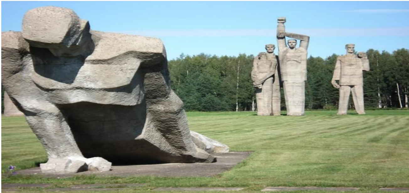
Памятник жертвам концлагеря.