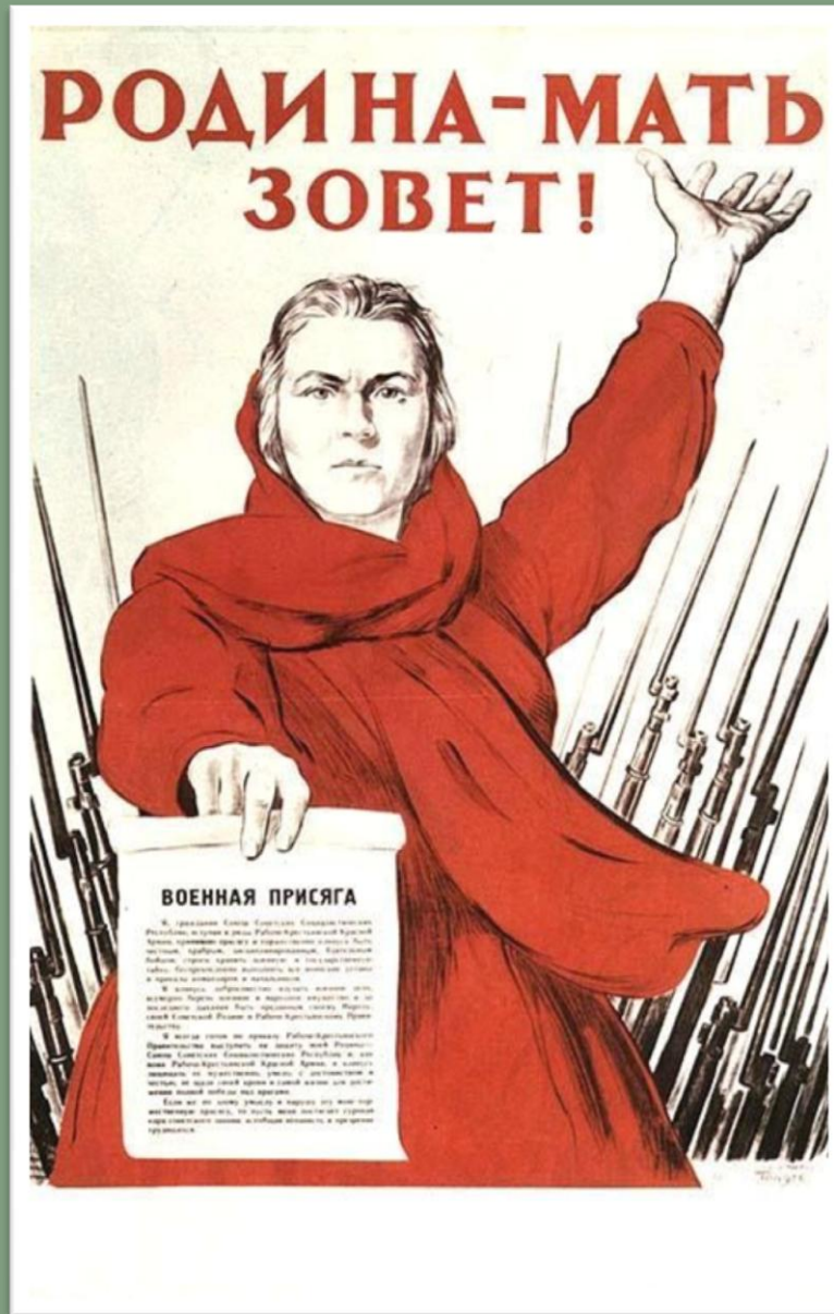
Среди первых плакатов Отечественной войны следует отметить плакат художника И. Тоидзе «Родина-мать зовет». Главную мысль плаката — Родина-мать зовет своих сыновей исполнить долг — защитить Отечество.