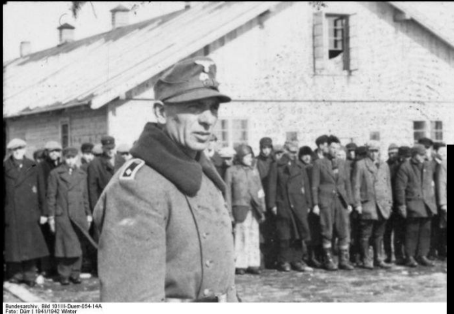
Bundesarchiv, Bild 101111-Duem-054-14A Foto: Dürr | 1941/1942 Winter

Всего через Саласпилский лагерь прошли около 100 тыс. заключенных.